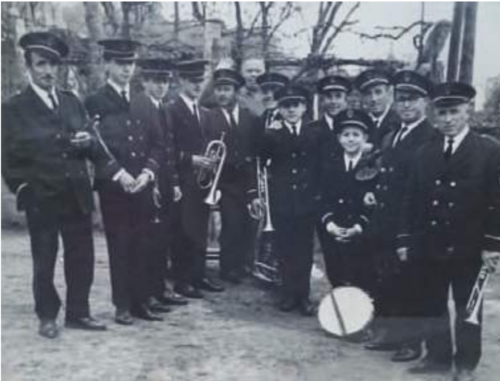
Compoñentes da Banda de Música Municipal de Padrón, todos eles naturais do lugar de Lestrobe, arredor do ano 1975, con motivo da inauguración da escola do lugar e celebración do Día da Árbore

Poucos lugares posúen unha tradición musical tan arraigada como o lugar de Lestrobe, no Concello de Dodro. Esa afección polo pentagrama transmitiuse familiarmente de pais a fillos e non era estraño que nunha mesma familia houbera varios músicos. Lestrobe é referente musical. Desde estas páxinas quero render unha pequena e sinxela homenaxe a todos aqueles músicos que fixeron posible que nos sintamos orgullosos desa tradición de bandas nas Terras de Iria.