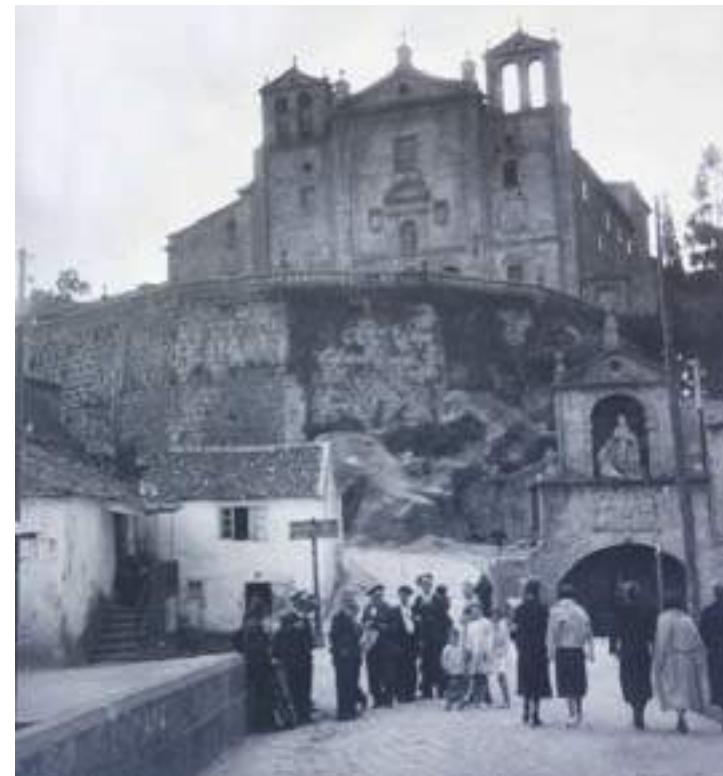
1935-01-01 / 1945-12-31. ca. 1935-1945 Números da Banda na Ponte Santiago