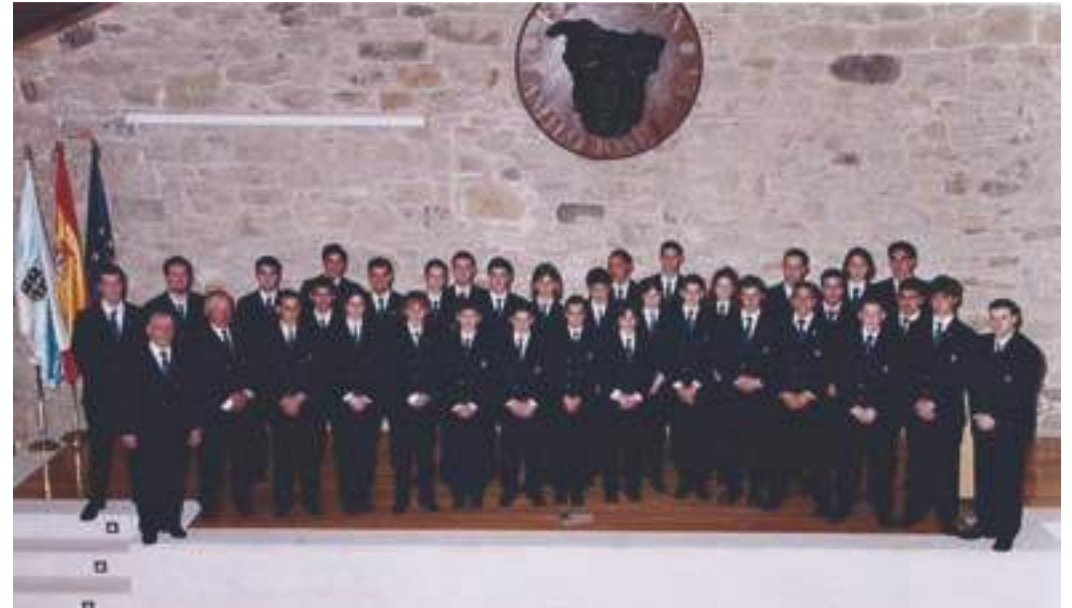
Banda Municipal Rosalía de Castro, no Auditorio da Fundación Pública Camilo José Cela (Iria Flavia)