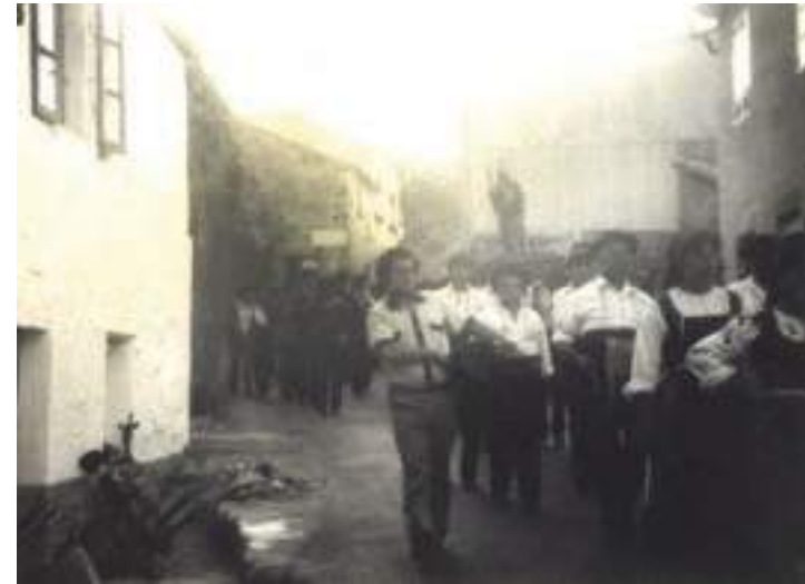
A Banda de Música, trala imaxe do "Parrandeiro", pola Trabanca de Arriba, despois de rematada a romaría do Santiaguíño do Monte