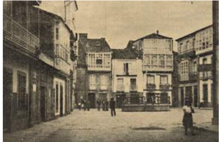
Palco da música, de madeira, na praza de Macías c.1940 para unha actuación da banda de música. Este palco seguía o formato do de pedra, trasladado para o Xardín botánico histórico artístico