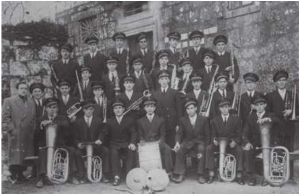
Foto da Banda do Carrandán fronte ao pazo de Lestrobe (Dodro), nas festas en loanza da Virxe dos Aflixidos