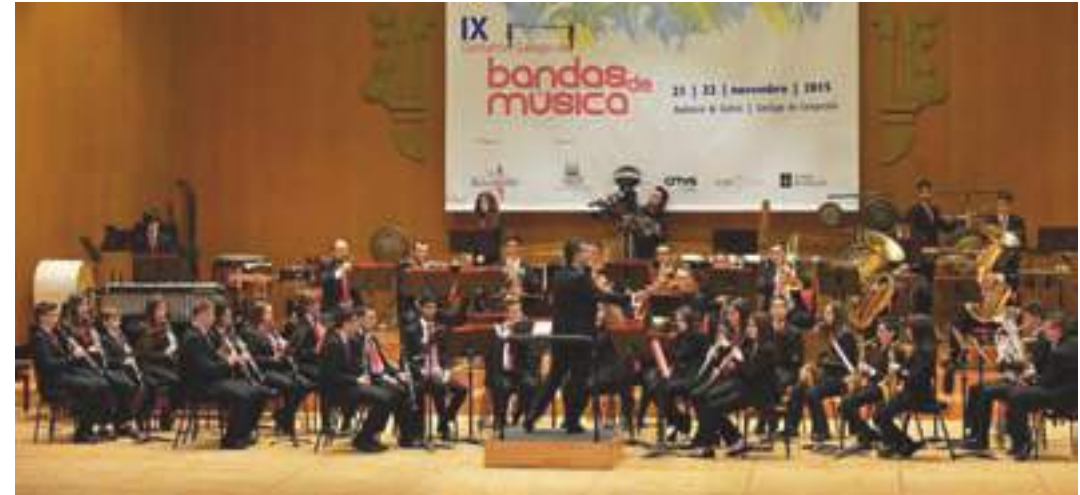
Foto da Banda de Música Municipal de Padrón no certame galego de Bandas de Música (xornal LVG 23/11/2015)

Nestes nove anos transcorridos, a banda vai da man da EMUS e converteuse nun auténtico viveiro de músicos que empeza a dar os seus froitos, como o acadado o 21 de novembro de 2015, cando resultou gañadora do IX Certame Galego de Bandas de Música en Santiago de Compostela. As súas actuacións espalláronse por diferentes localidades de Galicia, levando o nome do noso municipio alá onde actúa, o que constitúe un motivo de orgullo e satisfacción para o mantemento da cultura musical destas Terras de Iria.