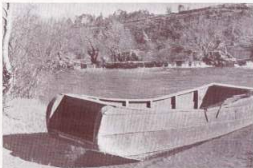
La presa «Areas» y, en primer plano, una de las típicas lanchas de Herbón

—Mire usted— nos informaba un día uno de los más importantes llevadores— hoy, por ejemplo, en el quifón «Cabildo», del que yo me llevo nueve quintos, fueron atrapadas ocho lampreas. Por consiguiente, me corresponde una lamprea y cuatro quintos de otra