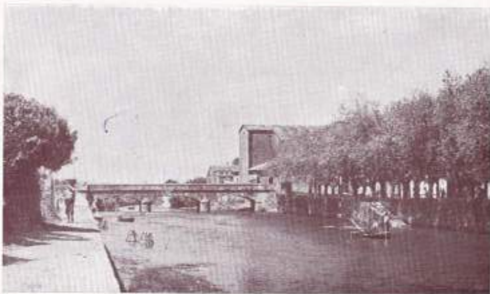
El río Sar a su paso por Padrón