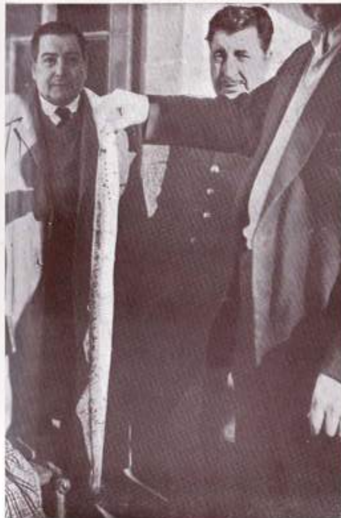
Un magnífico ejemplar de lamprea