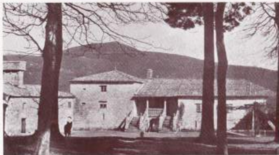
TORRE DO MONTE

¡Oh, viejos pazos padroneses, de porte noble y señero, ungidos ya por la mágica mano de la Historia!..