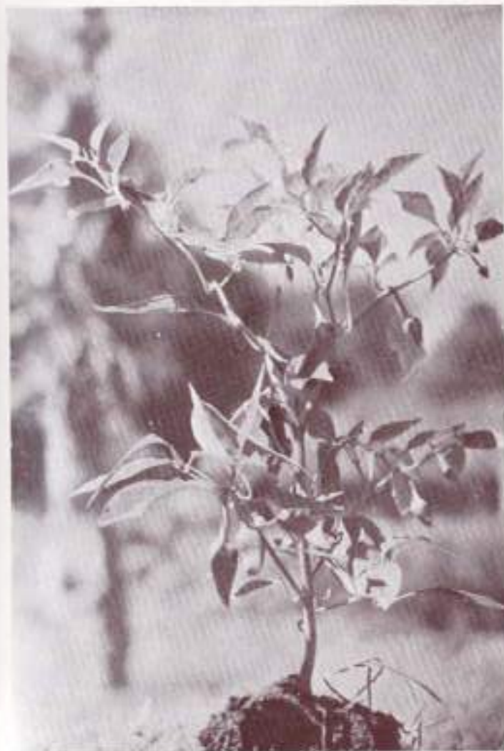
Primer plano de una planta «pimenteira» en plena producción