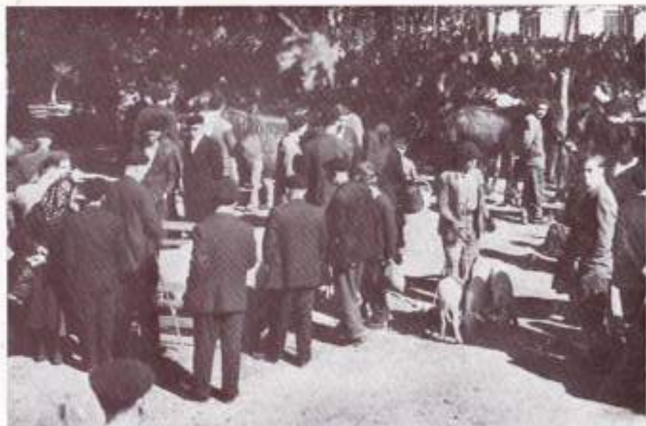
Un momento de la tradicional feria de Pascoa

Con relación al maíz, cultivo tan importante en esta vega, es de desear un aumento del rendimiento unitario, empleando los maíces híbridos y de tallo azucarado. Estos últimos cuando en la explotación se precisa obtener una mayor cantidad de forraje, con el fin de evitar el corte prematuro de los pendones de la planta, que hace disminuir en un 20 y hasta en un 25 por ciento el rendimiento en grano. Se impone también la lucha contra los gusanos del suelo, mediante el espolvoreo o pulverizaciones de insecticidas