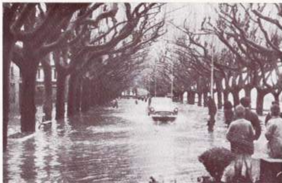
El río Sar invade el Paso del Espolón

Desde que el viento se declaró en vendaval, se ensombreció el cielo con un único nubarrón ceniciento y comenzó a llover sin pausa. En el mismo instante, los eucaliptos del Souto iniciaron un acompasado braceo — como remedando alguna danza litúrgica oriental — acompañándose de su propio rumor, profundo y dominante. Aquel sordo bramido, unido al tono sombrío del horizonte, proclamaban, sin lugar a dudas, la inminencia de la inundación, aunque, si bien tales señales eran sobradamente significativas para los naturales — aleccionados por antigua experiencia — no lo eran, en cambio, para los forasteros, a quienes les parecía remotísima posibilidad la de que el río Sar, reducido a esmirriado arroyo durante el estiaje, pudiera alguna vez salirse de madre.