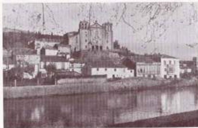
CONVENTO DE LOS DOMINICOS