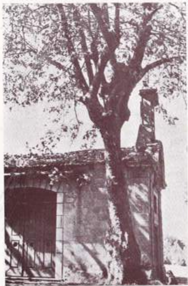
CAPILLA DEL MONTE «SANTIAGUÑO»