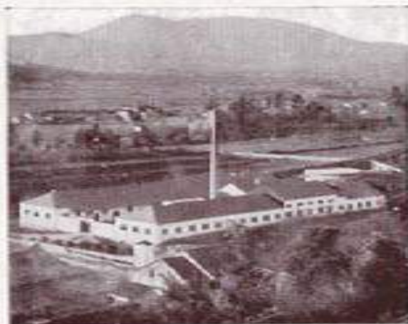
FABRICA DE LA MATANZA

FILIAL DE CURTIDOS ZARAGOZA, S. A. "CURTIZA" - BARCELONA