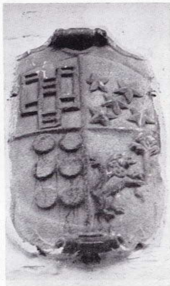
Escudo de los Castro, en Fondo de Vila.