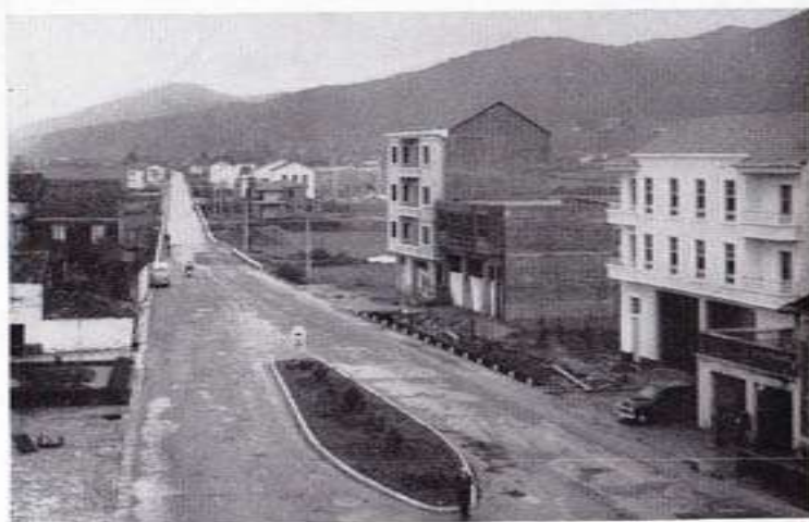
Un aspecto del Padrón moderno y progresivo.

Como modesto homenaje a su memoria, a los dos años de su fallecimiento, insertamos en este programa de Pascua dos de sus composiciones, en las que son ostensibles las características que apuntábamos: su tono reciamente viril y su amor a Padrón.