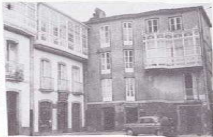
Plazuela de Baltar.

Prueba de lo que decimos: fue la ilusión que pasó siendo Director de aquel Centro, en intentar una importante reforma del mismo. Sofista, en efecto, que el Gran Hospital llegaría a estar dotado de todo género de elementos para que los enfermos estuvieran perfectamente atendidos y para que los médicos disfrutasen de la satisfacción interior que da el saber cubiertas todas las exigencias científicas. La institución estaría regida por un Patronato de hombres eminentes y dignos y en ella se centraría la lucha regional contra el cáncer. Pero