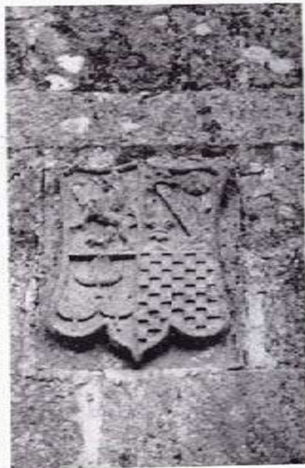
Armas de los Figueiredos.

cuartel con tres hojas de higuera, una de las brisuras—o formas—de Figueiredos y, ciertamente, la meno corriente, ya que lo normal