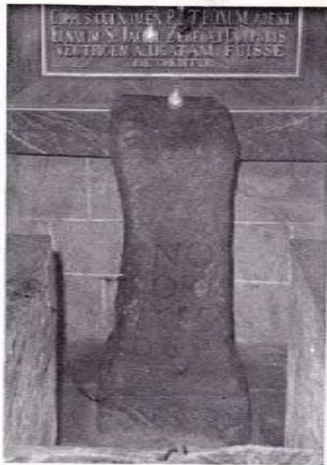
Pedrón, donde ataron la barca que traía los restos mortales del Apóstol Santiago y que se conserva debajo del altar mayor de la iglesia parroquial.