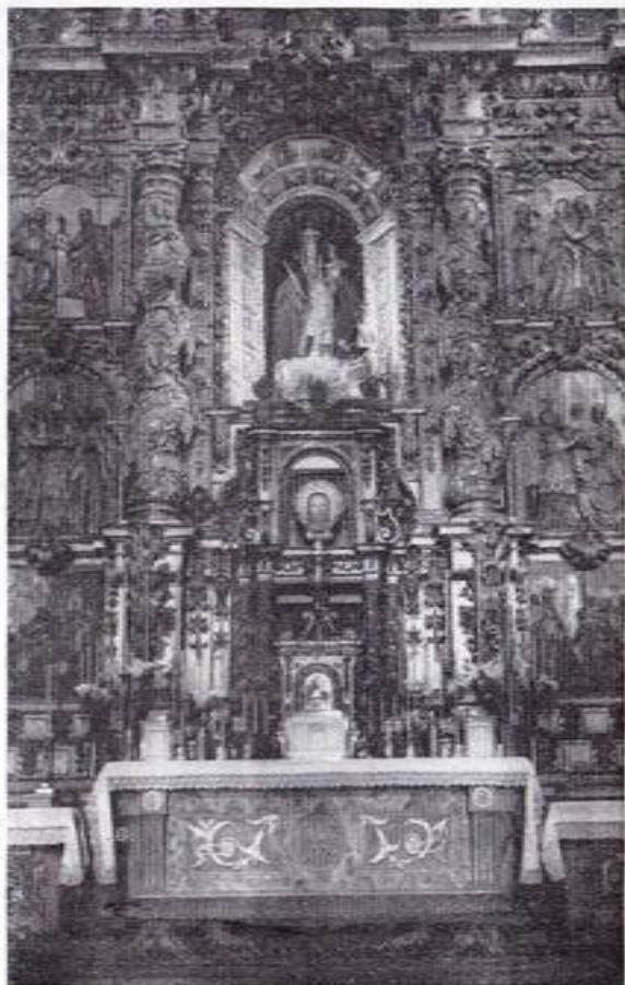
Altar Mayor de la Colegiata de Iria-Flavia

lado del Santo Cuerpo del Apóstol Santiago, del cual una representación pictórica de la escena nos la enseña un cuadro de autor anónimo, hoy en el Museo del Prado.