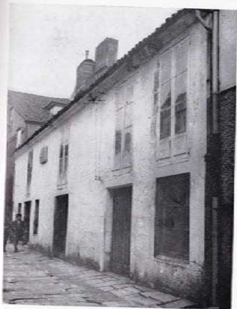
Casa n.º 4 de la calle de Juan Rodríguez.