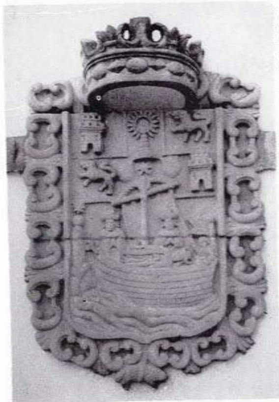
Escudo combinado existente en la "Caseta de la luz".

Este mismo escudo, se repite en la fachada del Ayuntamiento de Padrón. Ambos son barrocos y las variantes que acusan son de formato, si bien al de la Casa Consistorial le falta la alusión a Galicia y al Reino castellano-leonés.