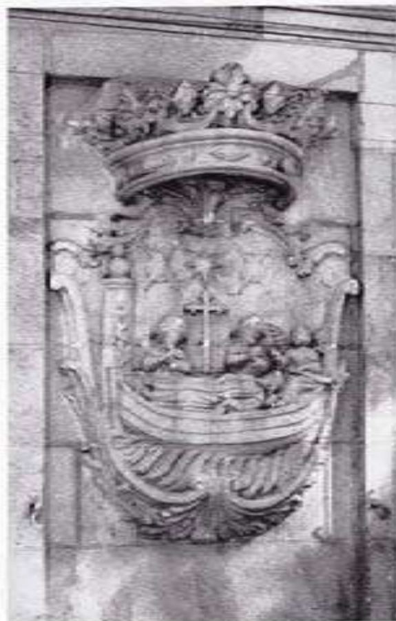
Escudo de la Villa.

Nosotros hemos traído a estas páginas solamente una breve selección de escudos de armas. Ofrecer todos, resultaría impropio de un programa de fiestas. Sin embargo, creemos que la muestra es suficientemente elocuente y prueba, sin género de duda, que nuestro pueblo tuvo destacada importancia en el desarrollo y avatares de las Casas solariegas que, en su tiempo, fueron las clases rectoras de toda la sociedad gallega.