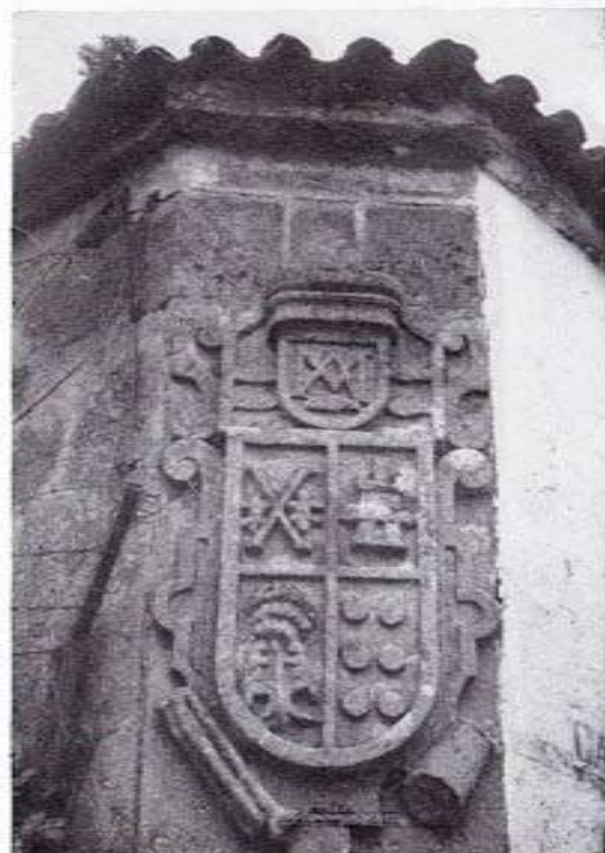
Escudo de los Castros, en Murgadán.