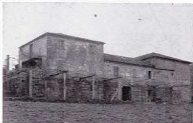
Torre de Hermida.