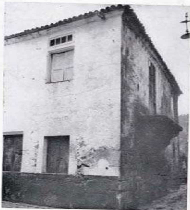
Casa dos Castros — Calle Murgadán.