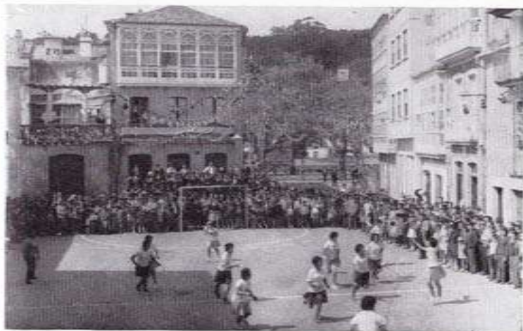
La plaza de Macías durante la celebración de un acto deportivo.

La Plaza de Macías es también una plaza musical, pues en ella se celebran los conciertos que se programan para amenizar las principales fiestas de la villa. En su ámbito, cualquier obra alcanza resonancias triunfales, especialmente cuando los platillos chocan con violencia. Y si bien es cierto que la melomanía es una tendencia muy