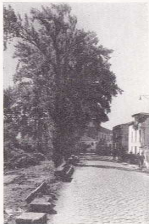
Avenida Rafael Gasset

Referencias interesantes, son también las que hace esta obra a dos romerías. La primera, la del Socorro —ya extinguida— que tenía lugar en Agro Novo, parroquia de Seira. El ambiente parece que estaba bastante animado, pues Barros dice que cerca de la ermita —hoy en ruinas— se encontró "algunos grupos de aldeanos, el infatigable gaitero con