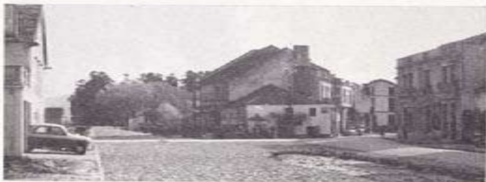
Avenida Rafael Castro

"Fue aquella la primera vez que hablé con ella —dice— si bien la conocía de vista hacía ya largos años. Nos recibió en su gabinete de trabajo, templo de las Letras y las Musas, sin más adorno que una modesta mesa escritorio, algunas sillas y una estensa estantería, repleta de libros, que ocupaban los cuatro lados de la habitación. Hablamos de diversos asuntos: de América, de Galicia, de Literatura, de la gloria y la fortuna. Su palabra líbil y simpática, su gracejo natural y de buen gusto, en que se des-