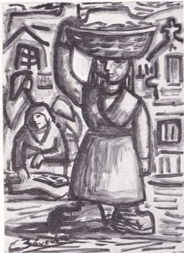
PEIXEIRAS DA MIÑA TERRA

(Ilustración del pintor padronés Carlos Bóveda)