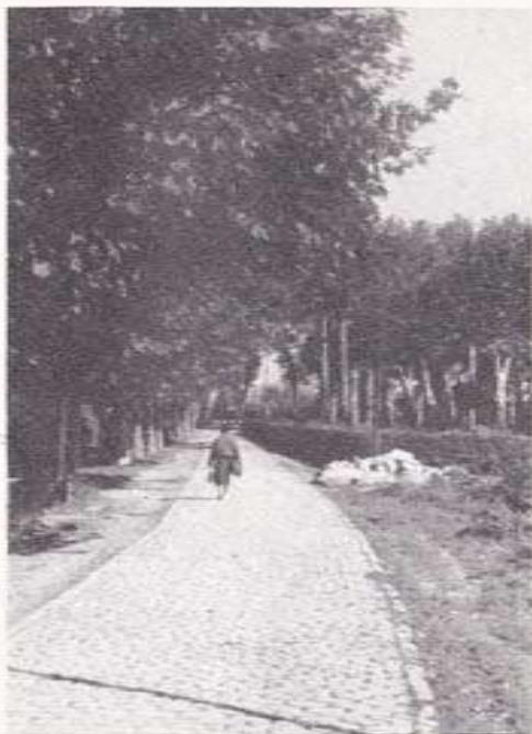
Camite de tras do Xardín

El otro personaje parece que no era de perfil tan grato. Se trataba —según se verá— de un clásico "rompetechos", empleando una calificación típicamente padronesa. Se le conocía por el sobrenombre de "Lamprea", un tipo de "oji-