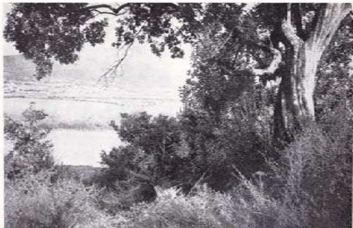
Torres de Hermida. Modroñeiro o pé do que escribiu Rosalia Castro