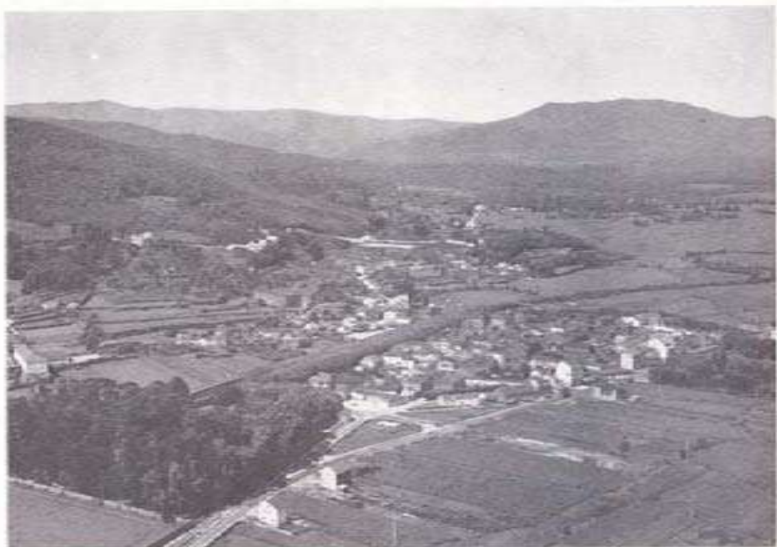
Vista aérea de la Villa de Padrón