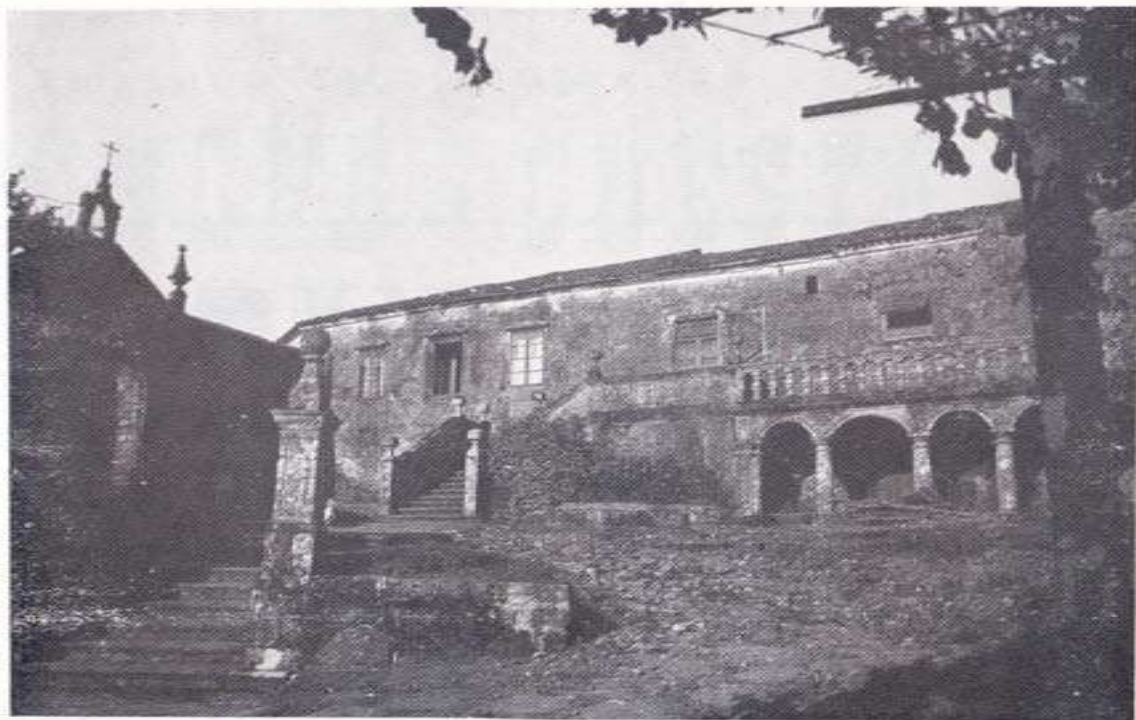
El Pazo de la Reten histórico en toda Galicia