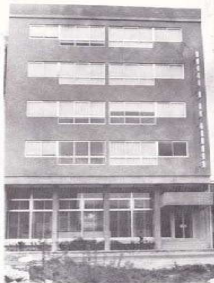
Uno de los últimos edificios construidos, sede del Banco de La Cruz.